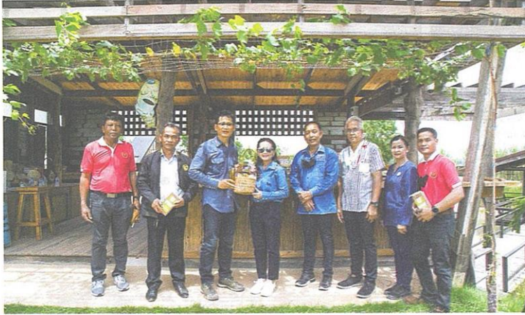
△ การพัฒนาการผลิตและการตลาดผลิตภัณฑ์จากข้าว กข69 (ทับทิมชุมแพ) ในจังหวัดขอนแก่น โดยกรมการข้าว และสำนักงานพาณิชย์จังหวัดขอนแก่น