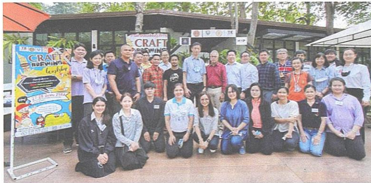
△ พิธีเปิดการฝึกอบรม CRAFT BREWING WORKSHOP รุ่นที่ 1 เพื่อเพิ่มมูลค่าข้าวทับทิมชุมแพ ณ คณะเทคโนโลยี มหาวิทยาลัยขอนแก่น

“ โดยข้าว กข69 (ทับทิมชุมแพ) เป็น 1 ใน 8 ของผลงานวิจัยใช้ได้จริง และมีการต่อยอดงานวิจัยเพิ่มขึ้นอย่างไม่หยุดยั้งมีการดำเนินการแปรรูปเพิ่มมูลค่าได้สูงหลายเท่าของราคาข้าวทั่วไป ทำให้ชาวนามีรายได้ที่เพิ่มมากขึ้น และผลิตภัณฑ์หลายประเภทชาวนาสามารถผลิตและทำตลาดเองได้ ”