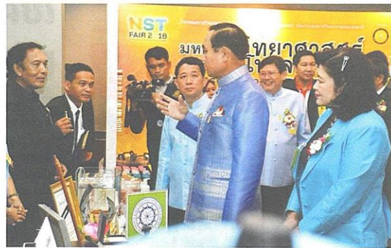
▲ บรรยากาศการออกบูทในงานมหกรรมงานวิจัยแห่งชาติ 2561 จัดโดยสำนักงานการวิจัยแห่งชาติ (วช.)