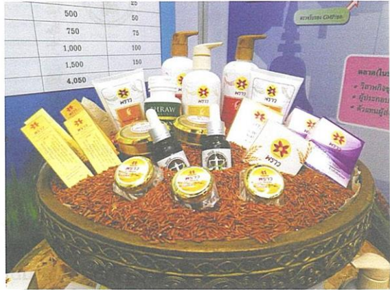
▲ ข้าว กข69 (ทับทิมชุมแพ) เป็น 1 ใน 8 ของผลงานวิจัยใช้ได้จริง ในงานมหกรรมงานวิจัยแห่งชาติ 2561 จัดโดยสำนักงานการวิจัยแห่งชาติ (วช.) ณ โรงแรมเซ็นทาราแกรนด์ และบางกอกคอนเวนชันเซ็นเตอร์ เซ็นทรัลเวิลด์ กรุงเทพฯ

“บทความนี้เป็นเรื่องราวบางส่วนเกี่ยวกับการนำข้าว กข69 (ทับทิมชุมแพ) ไปต่อยอดของภาคส่วนต่างๆ แก่ที่ผู้เขียนสามารถรวบรวมได้ในช่วง 2 - 3 ปีที่ผ่านมา ซึ่งเป็นการสร้างมูลค่าเพิ่มอย่างมาก ไม่เพียงทำให้ชาวนามีรายได้เพิ่มขึ้นเท่านั้น แต่เป็นตัวอย่งที่เกิดจากการบูรณาการของหน่วยงานภาครัฐหลายกระทรวง สถาบันการศึกษา ผู้ประกอบการและชาวนา ถือเป็นอีกก้าวแห่งความสำเร็จของ “โมเดลทับทิมชุมแพ” ที่สามารถเกิดมูลค่าเป็นเม็ดเงินกว่า 400 ล้านบาท ”