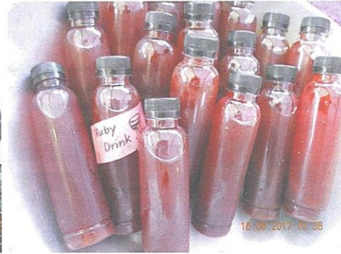
△ ผลิตภัณฑ์อาหารและเครื่องดื่มจากข้าว กข69 (ทับทิมชุมแพ)