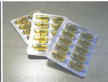
△ ตัวอย่างผลิตภัณฑ์ที่ติดตั้งเข้าสีทองที่เพาะจากข้าว กข69 (ทับทิมชุมแพ) และน้ำมันรำข้าว ผลิตภัณฑ์อาหารเสริมเพื่อสุขภาพจากข้าว กข69 (ทับทิมชุมแพ)