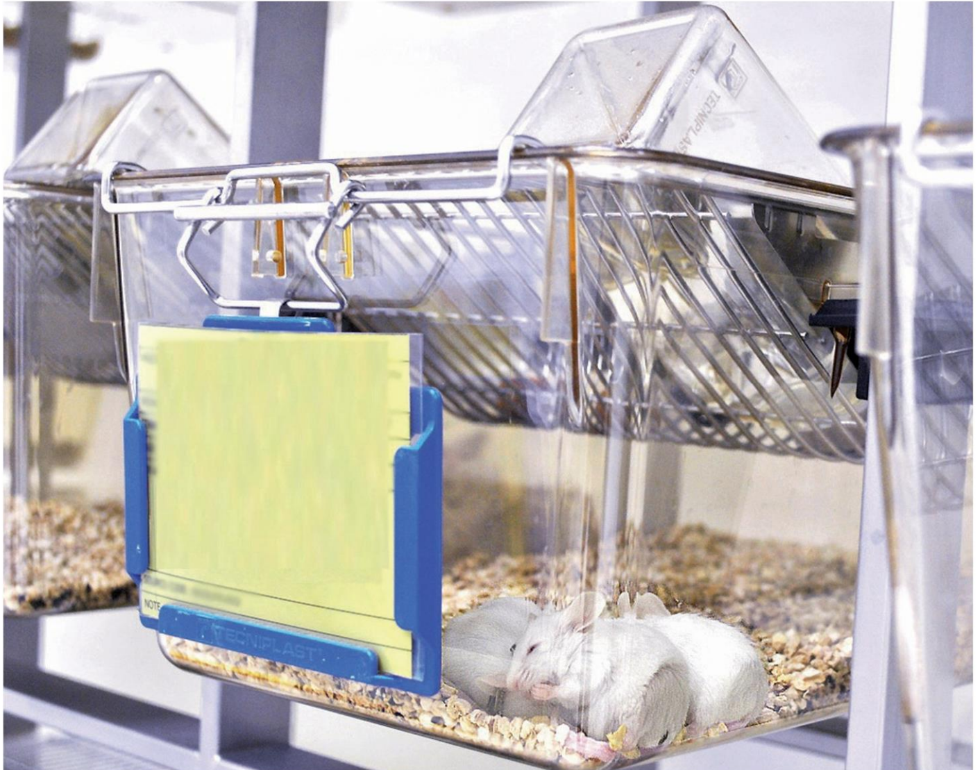
กรงเลี้ยงหนูไมซ์ หนูแรท หนูแฮมสเตอร์ หนูตะเภา และกระต่าย ศูนย์สัตว์ทดลอง มหาวิทยาลัยธรรมศาสตร์ ศูนย์รังสิต

หัวข้อข่าว: 'สัตว์ทดลอง' ความจริงนอกแอนิเมชั่น ในวันที่โลก #saveRalph