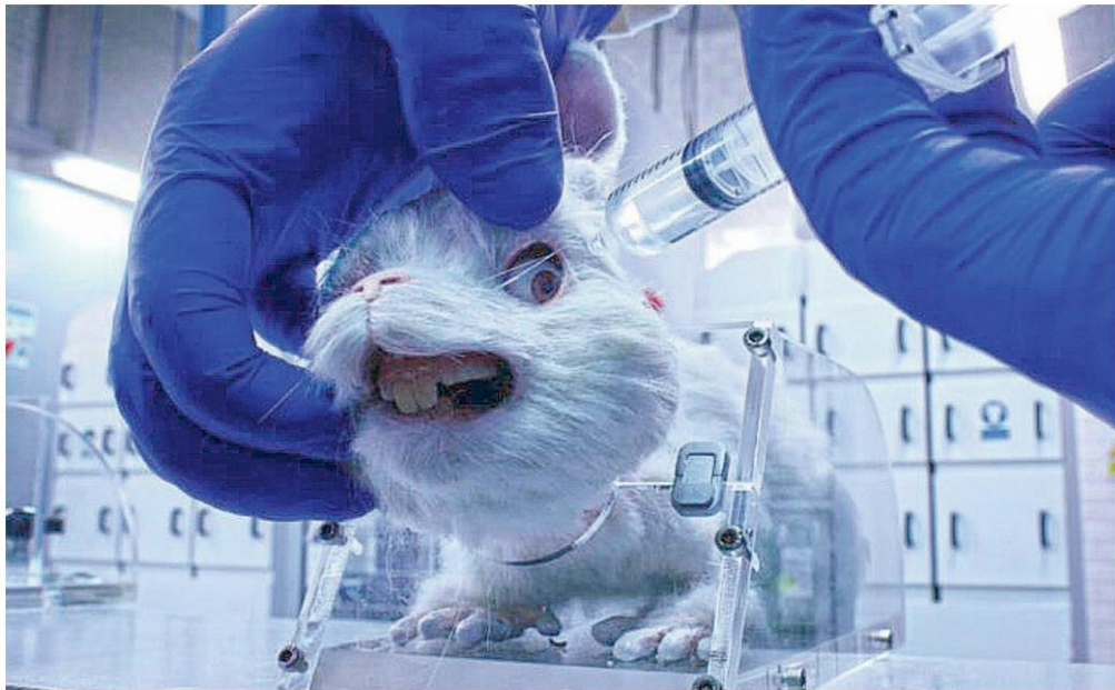
Ralph กระต่ายน้อยจากแอนิเมชั่น เป็นส่วนหนึ่งของโครงการรณรงค์ไม่ใช้สัตว์ในการทดลอง และยกเลิกการทารุณสัตว์ของ HSI เผยแพร่เมื่อวันที่ 6 เมษายน 2564 สร้างแรงสั่นสะเทือนทั่วโลก

เป็นแฮชแท็กติดเทรนด์ทวิตเตอร์ทั้งต่างประเทศและไทย แลนด์ในชั่วสัปดาห์ที่ผ่านมา สำหรับ #SaveRalph อันสืบเนื่องมาจากกระแสไวรัลในโซเชียลมีเดีย ภาพแอนิเมชั่นกระต่ายน้อยสีขาวไร้เดียงสาที่ใช้ชีวิตท่ามกลางเข็มฉีดยาและสารเคมีในหน้าที่ 'สัตว์ทดลอง' สร้างความสะเทือนใจผู้คนจากการตีแผ่ของ Humane Society International (HSI) ผ่านภาพยนตร์สั้น 'Ralph' ซึ่งมีความยาวไม่ถึง 4 นาที อันเป็นส่วนหนึ่งของโครงการรณรงค์ไม่ใช้สัตว์ในการทดลอง และยกเลิกการทารุณสัตว์