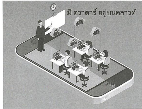
รูปที่ 3 การผสมการเรียนการสอนบนโลกกายภาพกับโลกไซเบอร์

จึงมีความสำคัญเพิ่มขึ้น ทักษะนี้ทำให้สามารถเข้าถึงข้อมูลข่าวสาร ความรู้ การอ่าน เขียนดิจิทัล ได้มากและเร็ว ออนไลน์จากทุกที่ ใช้สมาร์ตโฟนเพื่อการเรียนรู้และรับรู้ข่าวสาร บทบาทชีวิตวิถีใหม่ต้องใช้ทักษะดิจิทัล มีความสามารถในการใช้สื่อ การติดต่อสื่อสาร การทำงานร่วมกัน ทักษะการคิดเป็นระบบ การจัดการดูแลตัวตนในโลกไซเบอร์ รวมถึงการใช้อุปกรณ์ทางด้านดิจิทัล ใช้เทคโนโลยีดิจิทัลต่าง ๆ อย่างรู้คุณค่า มีคุณธรรมและจริยธรรมกับการใช้งาน มีความรับผิดชอบ การก้าวสู่เศรษฐกิจดิจิทัลของประเทศไทยเกี่ยวกับการใช้ดิจิทัลเป็นสำคัญ