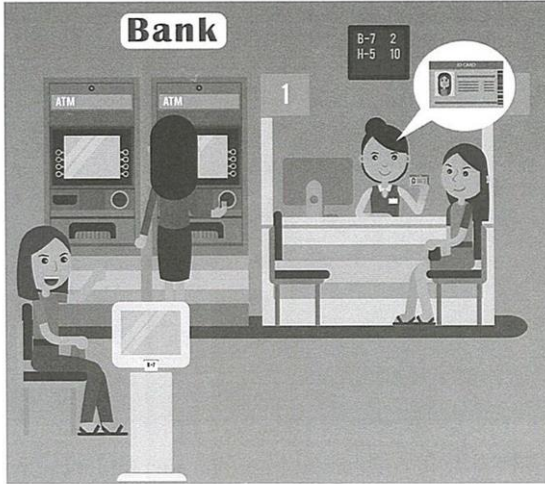
รูปที่ 4 การรู้จักตัวตนทางกายภาพ (Know Your Customer-KYC) เพื่อเชื่อมโยงอวตาร

อย่างมาก ทำให้มีข้อมูลข่าวสารมากมาย ท่วมทับ ทักชะการใช้ และการบริโภคข่าวสารอย่างรู้เท่าทันเป็นเรื่องสำคัญ เพราะผู้รับข่าวสารเป็นผู้เลือก วิเคราะห์ด้วยตนเอง ต้องคิด วิเคราะห์ แยกความจริงกับความเห็นได้ และรับรู้การมีข่าวปลอม ข่าวลวง จึงต้องเรียนรู้และมีทักษะในการใช้เทคโนโลยีในการรับข่าวสาร