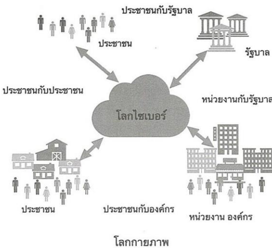
รูปที่ 5 ความสัมพันธ์ของประชาชนกับการเป็นพลเมืองดิจิทัลในโลกโซเชียล

อย่างมาก ทำให้มีข้อมูลข่าวสารมากมาย ท่วมทับ ทักชะการใช้ และการบริโภคข่าวสารอย่างรู้เท่าทันเป็นเรื่องสำคัญ เพราะผู้รับข่าวสารเป็นผู้เลือก วิเคราะห์ด้วยตนเอง ต้องคิด วิเคราะห์ แยกความจริงกับความเห็นได้ และรับรู้การมีข่าวปลอม ข่าวลวง จึงต้องเรียนรู้และมีทักษะในการใช้เทคโนโลยีในการรับข่าวสาร