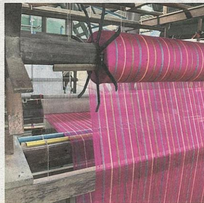
ผ้าขาวม้าลวดลายแบบใหม่ ที่อยู่ระหว่างการทอ