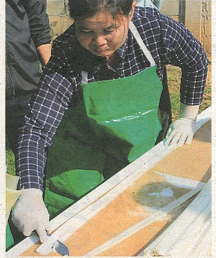
กรีดคันกล้วยเป็นชิ้นบางๆ

ที่เตรียมไว้เพื่อให้นุ่มและง่ายต่อการทอ ปรับเพิ่มความถี่ของทอเพื่อให้เส้นยืนมีความถี่ รวมทั้งปรับใช้พื้นทอที่สร้างขึ้นมาจากภูมิปัญญาชาวบ้าน เพื่อฝึกโยกกล้วย ให้มีขนาดเส้นใยที่มีขนาดละเอียดมากขึ้น เพื่อใช้ในการทอด้วยวิธีการทอพื้นเมือง ขณะเดียวกัน ชาวบ้านได้เรียนรู้เทคนิคการใช้วัสดุอย่างมีธรรมชาติในท้องถิ่น ได้แก่ ใบตะเคียนหนุม (ใบหว) ค่าเสด (ค่าเง) เปลือกประตู กระเจี๊ยบแดง ต้นขนุน ใบมะม่วง และเทคนิคการย้อมเส้นใยด้วยสารส้ม จุนสี โคลน น้ำขี้เถ้า และน้ำปูนใส รวมทั้งถ่ายทอดเทคนิคการสร้างลวดลายในการทอมาจากการสอดเส้นใยกล้วยและการสร้างลวดลายที่แตกต่างจากการทอผ้า เพื่อสร้างลวดลายใหม่ๆ ได้ตามความต้องการ ทีมนักวิจัยและชาวบ้านได้ร่วมกันพัฒนาการยกระดับผลิตภัณฑ์ในรูปแบบต่างๆ เช่น กระเป๋าถือสุภาพสตรี หลากหลายขนาด โดยจำหน่ายสินค้ากระเป๋านีราคา ใบละ 3,800 บาท นำไปสู่วิสาหกิจชุมชนที่ทันสมัย ชุมชนมีโอกาสได้รับการคัดเลือกเป็นแหล่งท่องเที่ยวต้นแบบส่งเสริมรายได้และเศรษฐกิจในชุมชนให้มีความเข้มแข็ง สร้างรายได้ และโอกาสทางการตลาดและช่องทางในการจัดจำหน่ายของผลิตภัณฑ์งานหัตถกรรม เพื่อจำหน่ายให้กับผู้บริโภคทั้งในและนอกชุมชน