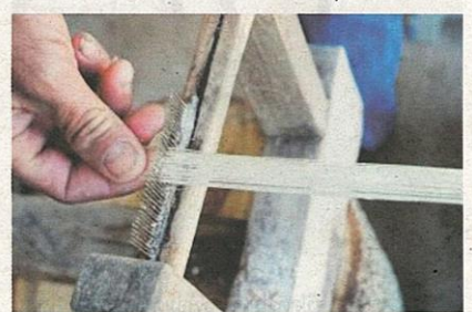
แปรรูปเป็นเส้นใยกล้วย

ทีมนักวิจัยได้นำองค์ความรู้เรื่องทฤษฎี คุณลักษณะเส้นใย กระบวนการขึ้นเส้นยืน การแปรรูปผลิตภัณฑ์มาถ่ายทอดให้ชาวบ้าน ออกแบบสีสำหรับลายผ้าขาวม้าในรูปแบบใหม่ โดยวางแผนสีให้ทันสมัย ผักฝนการขึ้นเส้นยืนได้ด้วยตัวเอง โดยใช้หลักการคำนวณเส้นยืน นำความรู้เรื่องคุณสมบัติของเส้นใยชนิดต่างๆ มาเลือกใช้ให้เหมาะสมกับผลิตภัณฑ์ผ้า