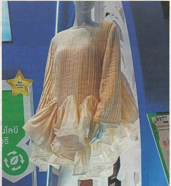
ชุดแฟชั่นจากเส้นใยกล้วยของ มทร. รัตนบุรี ได้รางวัล Platinum Award

การนำเข้าเส้นใยธรรมชาติจากต่างประเทศ และช่วยเพิ่มทางเลือกใช้ผ้าจากเส้นใยธรรมชาติให้กับผู้ประกอบการแฟชั่น เครื่องแต่งกายและเคหะสิ่งทอภายในประเทศ