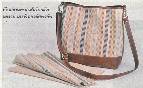
หัตถกรรมจากเส้นใยกล้วย ผลงาน มหาวิทยาลัยพายัพ

มหาวิทยาลัยเทคโนโลยีราชมงคลรัตนบุรี (มทร. รัตนบุรี) เป็นหนึ่งในสถาบันการศึกษาที่สนใจกระแสแฟชั่นรักษ์โลก จากเส้นใยกล้วย สิ่งทอ Eco-friendly ที่เป็นมิตรต่อสิ่งแวดล้อม อาทิ เสื้อผ้า กระเป๋าถือ หมวก และรองเท้า ฯลฯ ทีมนักวิจัยได้นำวัสดุเหลือใช้จากการกระบวนการผลิตกล้วยมาพัฒนาเป็นเส้นใยอุตสาหกรรมสิ่งทอ เพื่อสร้างมูลค่าเพิ่ม ลด