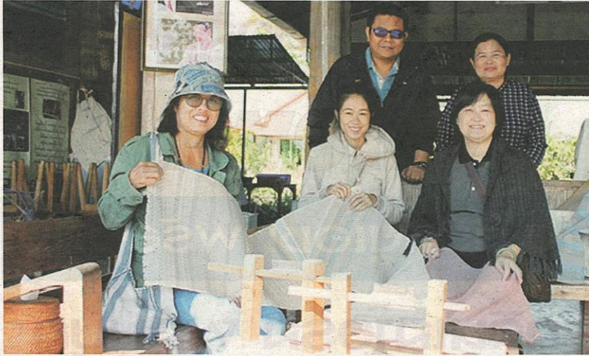
ทีมนักวิจัยของมหาวิทยาลัยพายัพ