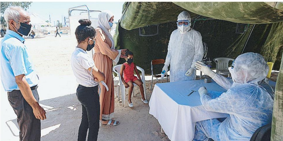
รอดตรวจ ประชาชนเข้าแถวรอเข้าตรวจโควิด-19 จากเจ้าหน้าที่แพทย์ของโรงพยาบาลทหารในเมืองอัล ฮามา ตอนใต้ของเมืองเกบส์ เมืองหลวงของประเทศ คูนิเซีย หลังพบมีผู้ติดเชื้อไวรัสร้ายในเมืองนี้.