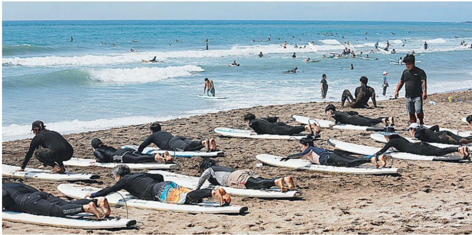
ห่างไวรัส ชายหาดเกาะเชจู เมืองท่องเที่ยวชายทะเลของ เกาหลีใต้ มีประชาชนไปท่องเที่ยวตากอากาศและเล่นเซิร์ฟกันเป็นกลุ่มใหญ่ ขณะที่ยังมีการระบาดของโควิด-19 รอบใหม่ในกรุงโซลเกาหลีใต้.