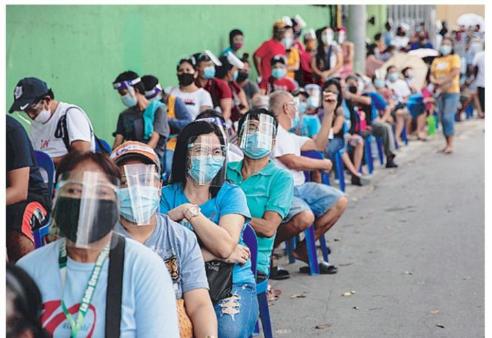
รอเงินเยียวยา ประชาชนจำนวนมากเข้าแถวยาว เพื่อรอรับเงินเยียวยาจากรัฐบาล เพราะได้รับผลกระทบจากโควิด-19 ที่กรุงมะนิลา ฟิลิปปินส์.