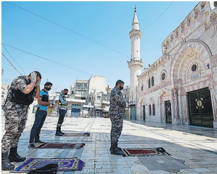
ศรัทธา เจ้าหน้าที่ตำรวจยืนสงบนิ่งเพื่อทำพิธีละหมาดวันศุกร์ที่ด้านนอกมัสยิดเมืองอัมมาน จอร์แดน ที่อยู่ระหว่างเคอร์ฟิว แก้ปัญหาโควิด-19.