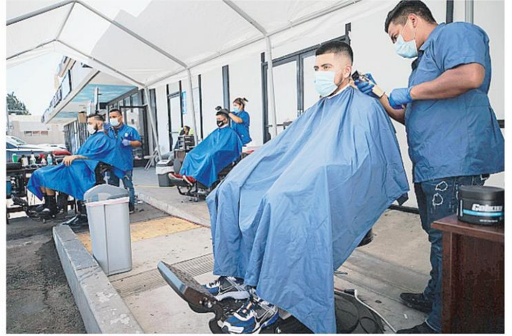
ตัดนกร้าน ทางกรมเมืองลอสแอนเจลิส รัฐแคลิฟอร์เนีย สหรัฐฯ อนุญาตให้ร้านตัดผมให้บริการลูกค้านกร้านเท่านั้น เพื่อป้องกันโควิด-19.