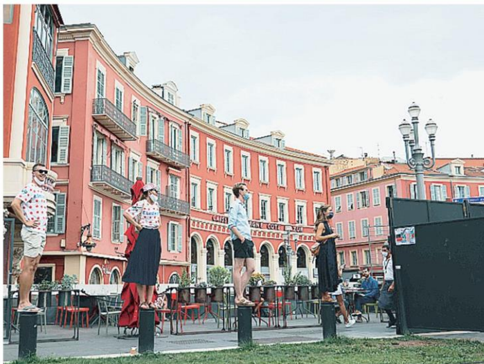
ขอดูหน่อย ประชาชนมองข้ามแผงกั้น ชมการแข่งขันจักรยาน ทัวร์เดอ ฟรองซ์ ในเส้นทางที่เมืองนีส ฝรั่งเศส ที่จำกัดคนดู เพื่อป้องกันโควิด-19.