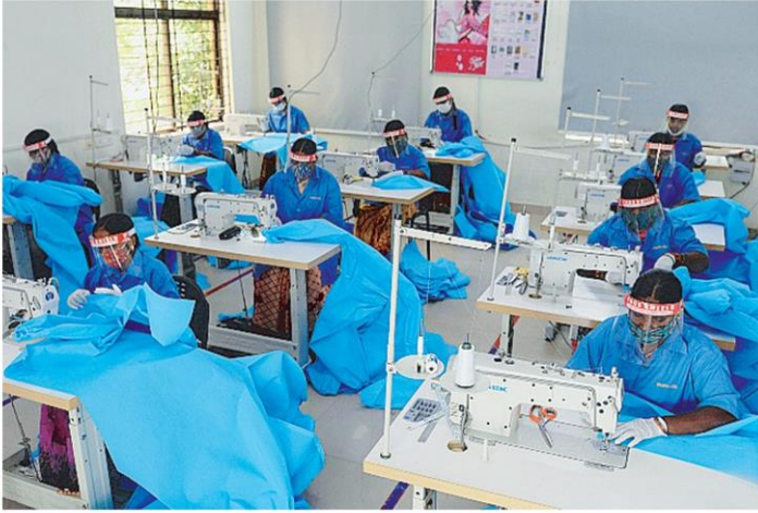
ช่วยกัน เจ้าหน้าที่อาสาสมัครช่วยกันเย็บชุดป้องกันการติดเชื้อที่เพื่อ ป้องกันโควิด-19 ให้กับเจ้าหน้าที่แพทย์ ที่เมืองไฮเดอราบัด อินเดีย.