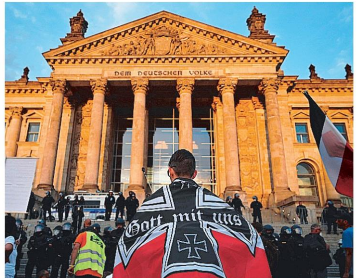
ประท้วง กลุ่มชาวจักรวรรดิประท้วงที่หน้าอาคารศูนย์ประชุมไรชส์ทาค กรุงเบอร์ลิน เยอรมนี ปฏิเสธมาตรการแก้ปัญหาโควิด-19 ของรัฐบาล.