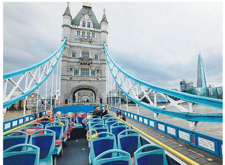
ทัวร์เหงามารถ ทัวร์ชมเมืองกรุงลอนดอน อังกฤษ ในบรรยากาศที่เงียบเหงา ไร้นักท่องเที่ยว เพราะมีโควิด-19 ขณะวิ่งผ่านสะพานทาวเวอร์บริดจ์.