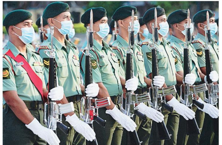
สวมหน้ากาก ทหารกองเกียรติยศสวมหน้ากากอนามัยป้องกันโควิด-19 ช้อมพิธีสวนสนามเนื่องในวันประกาศเอกราชที่เมืองปุตราชายามาเลเซีย.