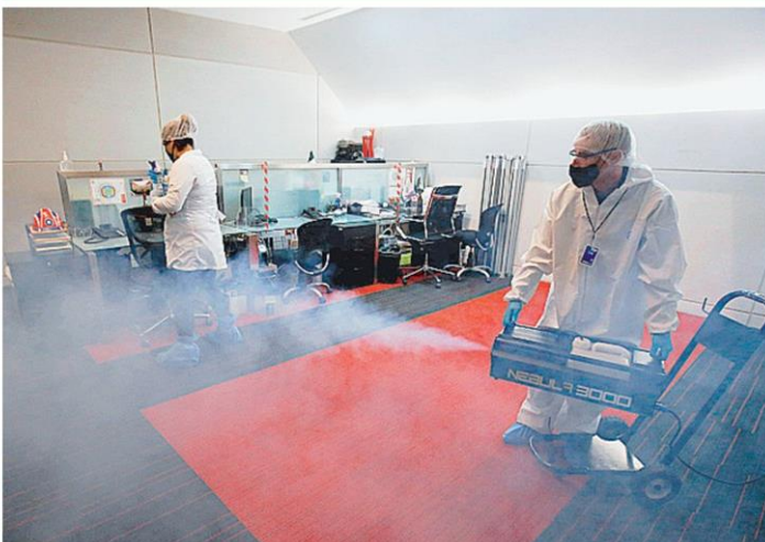
ฆ่าเชื้อโรค เจ้าหน้าที่สาธารณสุขฉีดพ่นน้ำยาฆ่าเชื้อโรค ป้องกันโควิด-19 ก่อนการแข่งขันฟุตบอลอาชีพเม็กซิโก ที่เมืองกัวดาลajara เม็กซิโก.