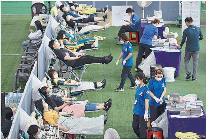
ทำวัคซีน สมาชิก โบสถ์ชินซอนจิม เมืองแดกู เกาหลีใต้ ที่ป่วยและหายจากโควิด-19 บริจาคเลือดและพลาสมา เพื่อนำไปวิจัยทำวัคซีนป้องกันโควิด-19.